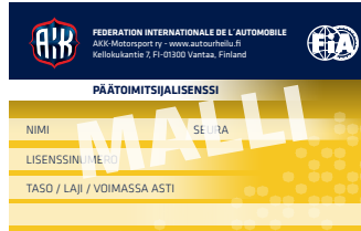
Päätoimitsijalisenssi (vasemmalla vm. 2018 ja oikealla vm. 2024)