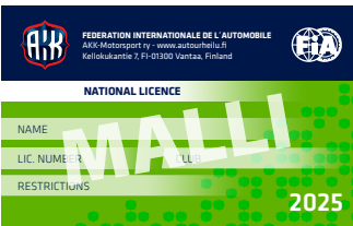
National-lisäkortti kansallisen lisenssin haltijalle.